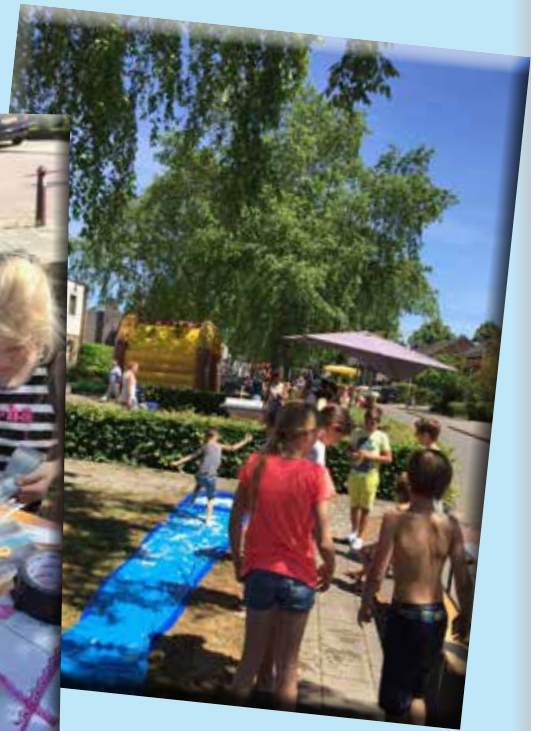
buitenspeeldag 14 juni 2017 in Oss Zuid