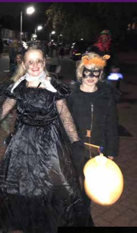
Haloween 2018 Het was weer gezellig griezelen!