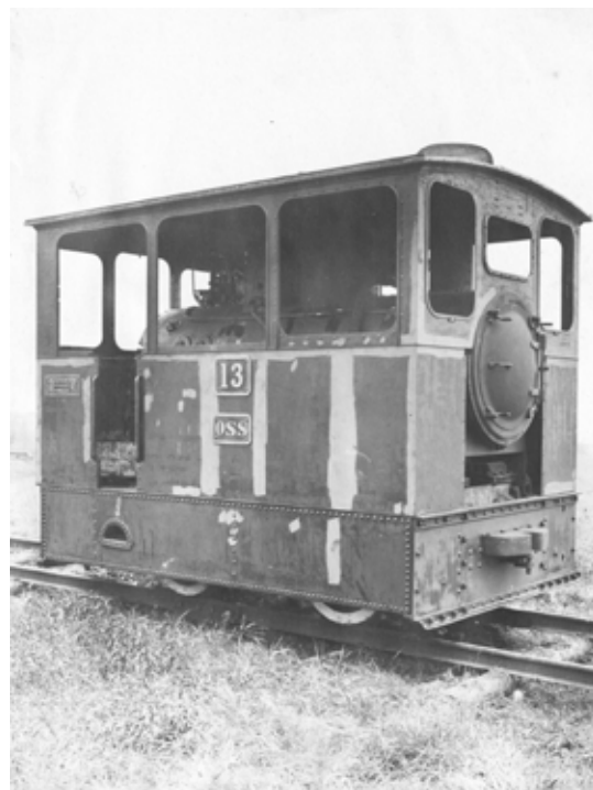
de stoomlocomotief, Oss 13

Op bladzijde 1 staat een advertentie voor de tram.