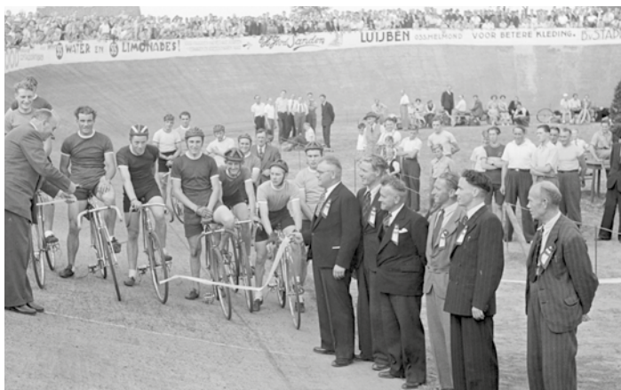
6 augustus 1950: opening wielerveebaun

In Oss ziet in 1948 wielerveevereniging 'De Komeet' het levenslicht. De vereniging had een grote wens: een wielerveebaun. Met vereende krachten van leden van de Komeet en het Eindhovense schilderbedrijf Van