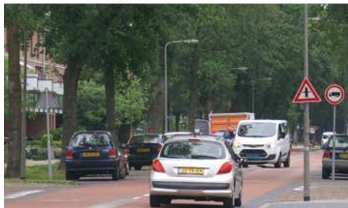
het 'fietskroontje' en het landelijke bord