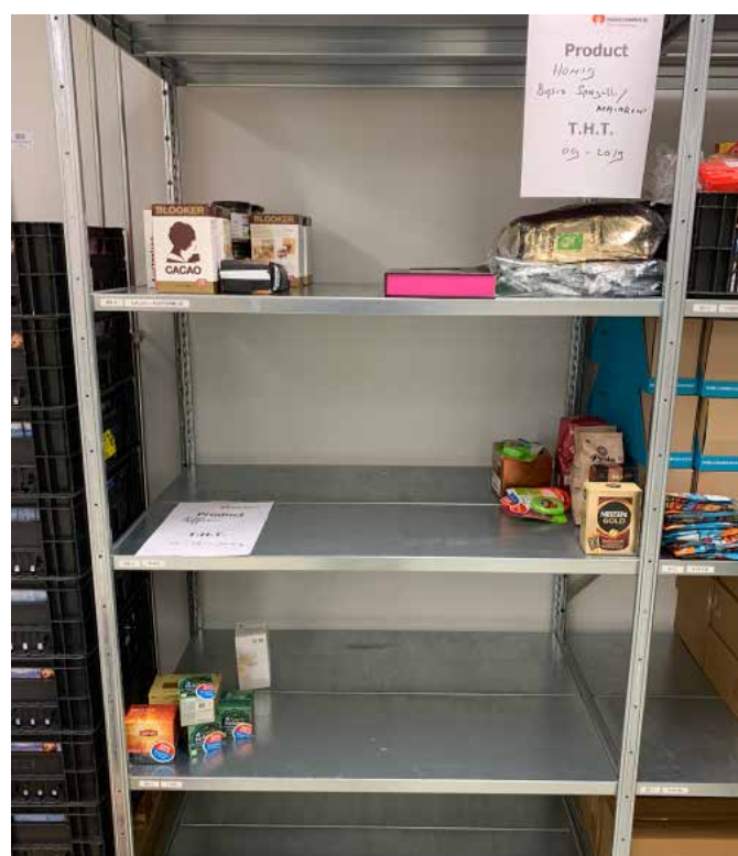
lege schappen, na de Kerstmarkt nog steeds?