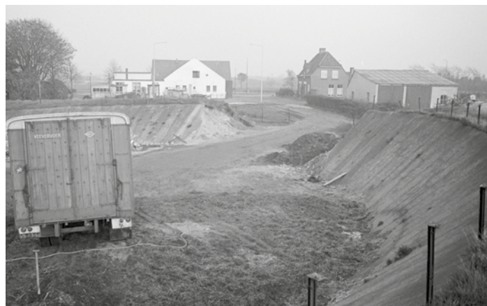
rond 1964, mest en zandopslag, einde van de wielerveebaun