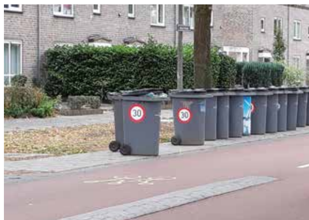
stickers op de kliko's