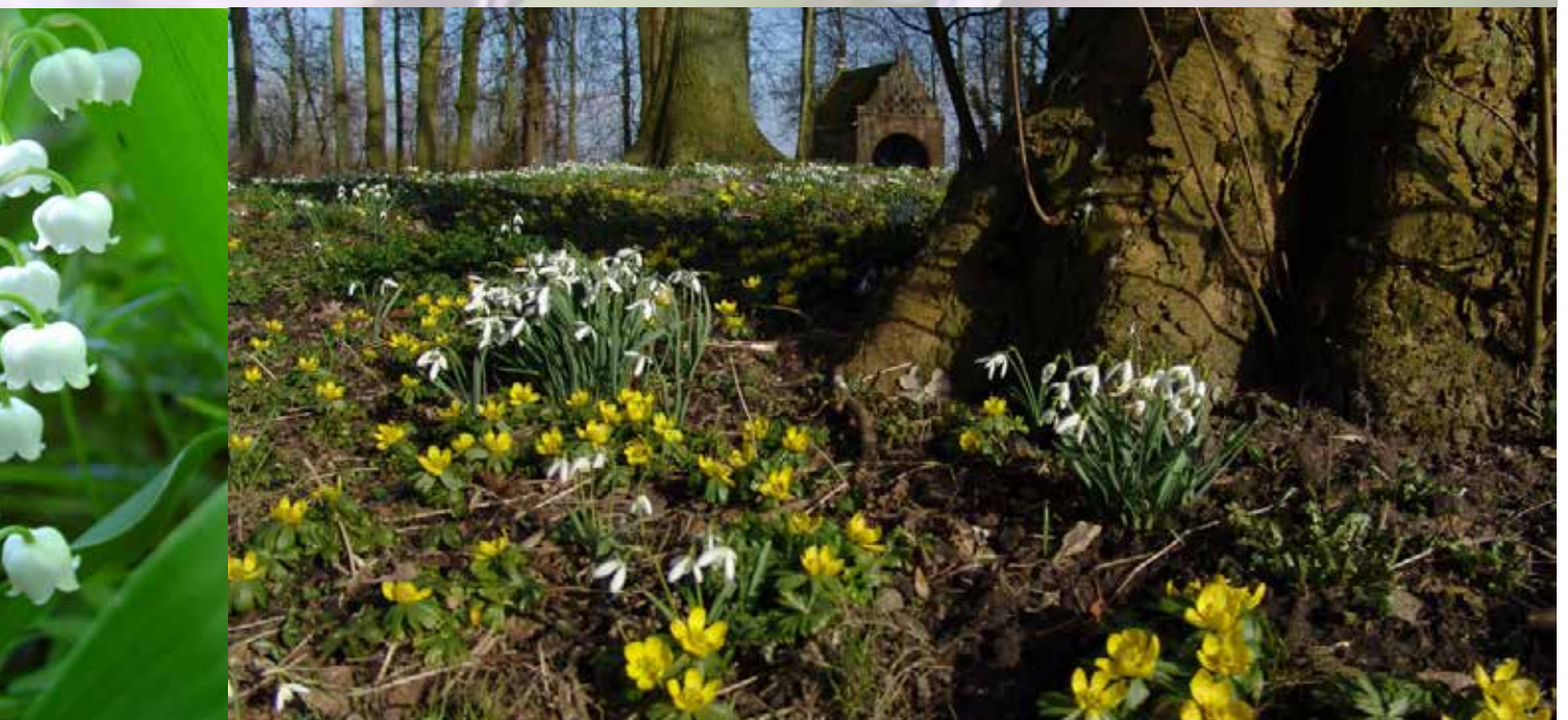
Foto winterakonieten en sneeuwkllokjes Jongemastate het Fryske Gea