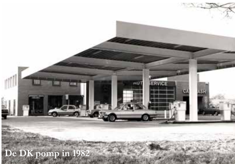
De DK pomp in 1982

Met de oliehandel kwam je vroeger bij de mensen thuis en dan hoorde je wat er speelde."