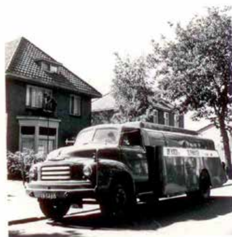
Petroleum lossen aan de Kortfoortsestraat 30